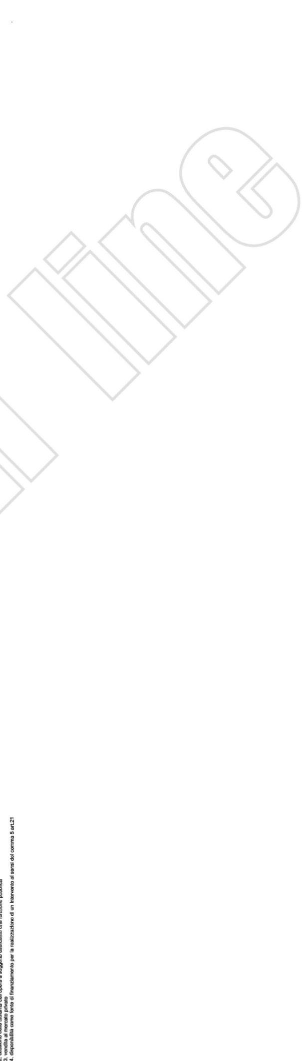
Tabella C.1 1. n° 2. n° 3. n° Tabella C.2 1. n° 2. n° 3. n° Tabella C.3 1. n° 2. n° 3. n° Tabella C.4 1. n° 2. n° 3. n° 4. n°

Note: (1) Codice obbligatorio: "I" = numero immobile + cf amministrazione + prima annualità del primo programma nel quale l'immobile è stato iscritto + progressivo di 5 cifre (2) Riferimento al codice CUI dell'intervento (nel caso in cui il CUP non sia previsto obbligatoriamente) al quale la cessione dell'immobile è associata; non indicare alcun codice nel caso in cui si proponga la semplice alienazione o cessione di opere incomplete non connesse alla realizzazione di un intervento (3) Se derivato da opera incompleta riportare il relativo codice CUP (4) Ripetere l'ammontare con il quale l'immobile costituisce a finanziare l'intervento, ovvero il valore dell'immobile da trasferire (qualora parziale, quello relativo alla quota parte oggetto di cessione o trasferimento) o il valore del titolo di godimento oggetto di concessione.